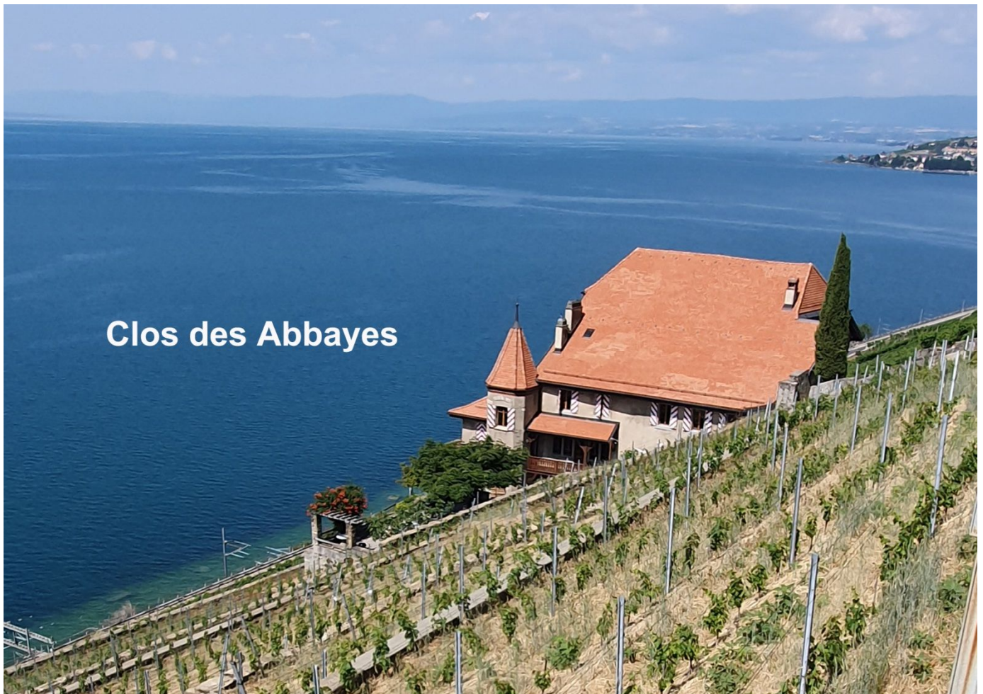
Clos des Abbayes