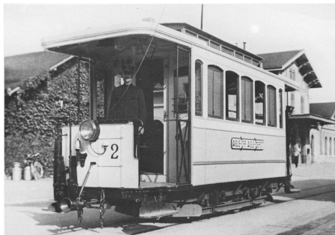
Tramway Aigle-Aigle Grand-Hôtel sur la place de la Gare, à Aigle.